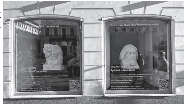
Студенты-реставраторы провели реконструкцию моделей пяти памятников по скудным фотодокументам

кусство советской России, сообщает Государственный музей городской скульптуры.