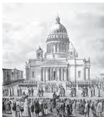
Освящение Исаакиевского собора 30 мая 1858 года. Литография XIX века

В связи со строительством и освящением собора Александром II была учреждена государственная награда — медаль «В память освящения Исаакиевского собора». Награждались ей лица, принимавшие участие в строительстве, украшении и освящении собора.