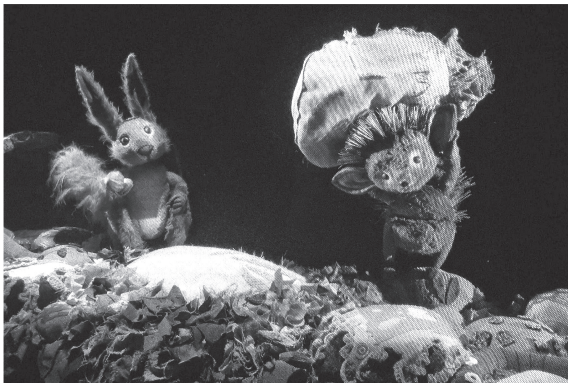
Спектакль «Сказка о Ежике, волшебном лесе и еще кое о чем...» получил награду за лучшее музыкальное оформление и звание «Лучший детский спектакль фестиваля»

1 В России официально зарегистрировано 183 кукольных театров. При этом общее число театров, которые имеют сегодня статус государственных, 647.