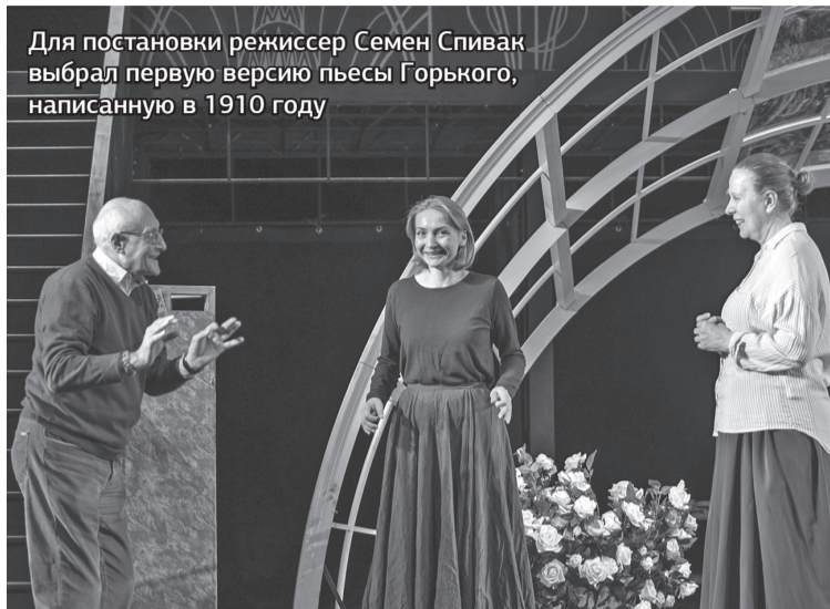
Для постановки режиссер Семен Спивак выбрал первую версию пьесы Горького, написанную в 1910 году

В год 155-летия со дня рождения Максима Горького Молодежный театр впервые обращается к одной из самых известных пьес этого писателя и драматурга. «Васса Железнова» многократно входила в репертуар ведущих театров страны, получила несколько киноплощадок. Ролью Вассы отмечены биографии таких прославленных актрис как Фаина Раневская, Вера Пашенная, Серафима Бирман, Татьяна Доронина, Инна Чурикова, Светлана Крючкова. В спектакле Молодежного театра роль Вас-