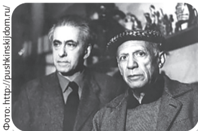
Илья Эренбург и Пабло Пикассо. Франция, Вал-лорис. 1954