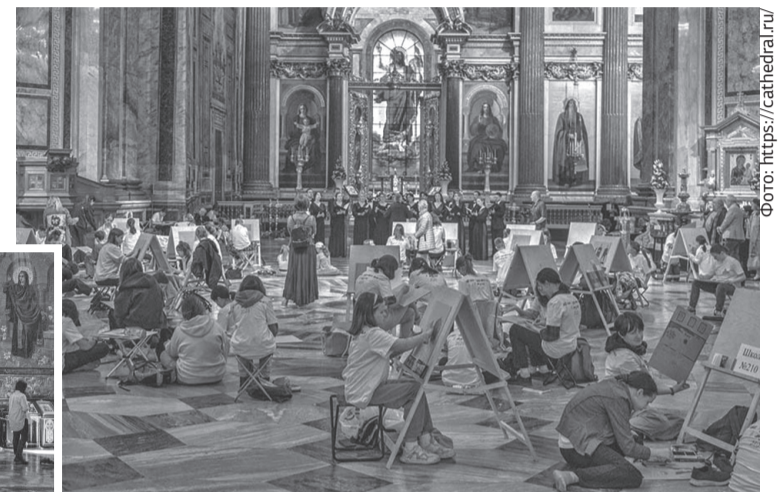
Одним из направлений деятельности Государственного музея-памятника «Исаакиевский собор» является развитие творческого потенциала юных талантов

В мероприятии участвовали воспитанники Детского творческого центра Государственного музея-заповедника «Павловск»; Детской художественной школы (г. Гатчина); Детской художественной школы имени И. П. Саутова (г. Пушкин); Академия дополнительного профессионального образования; школа-интернат № 1 имени К. К. Грота и коррекционная образовательная школа № 522.