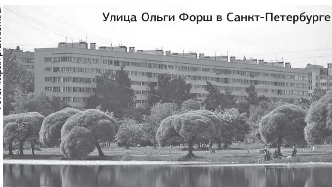
Улица Ольги Форш в Санкт-Петербурге

Улицы, носящие имя писательницы, есть также в Волгограде, Гунибе (Дагестан), Измаиле (Украина).