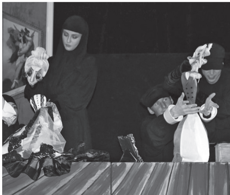
В спектакле «Шутки и новеллы Чехова» хочется отметить умение артистов театра работать в ансамбле над образом одной куклы

В том, что артисты Чувацкого театра кукол профессионально могут работать с самыми сложными куклами, довелось убедиться еще в прошлый приезд, когда они коллективными ансамблевыми усилиями создали образ «Ледяной стужи» в «Снегурочке». Нынче, в «Ежике» на каждую куклу приходилось по два три исполнителя. Кроме того, историю об одиноком герое,