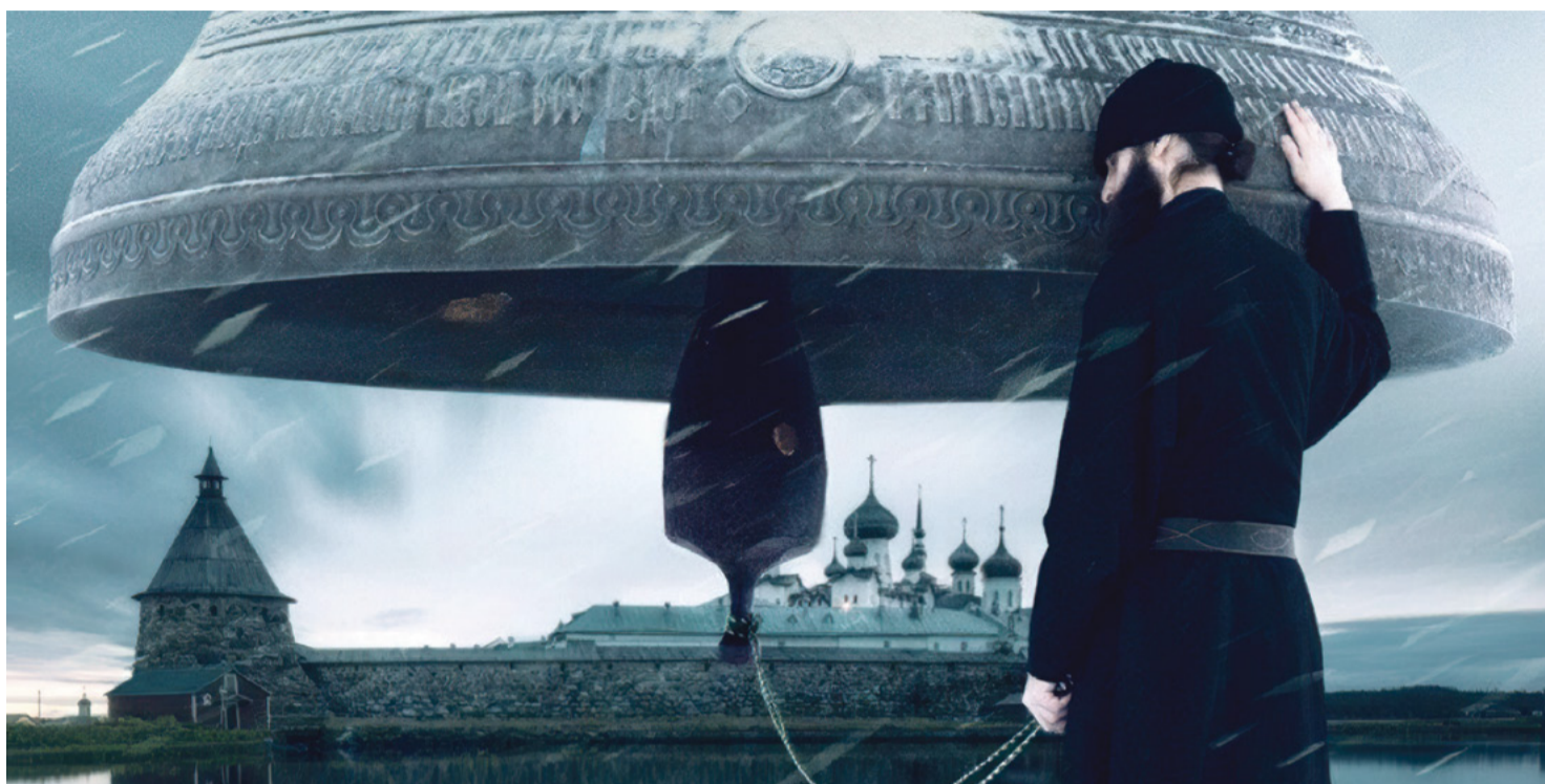
Кадр из фильма «Святой архипелаг», режиссёр – Сергей Дебижев, оператор – Алексей Немов

– Я родилась в Архангельске и 65 лет прожила там. Благодаря фильму я вер-