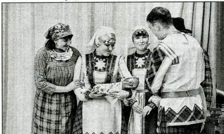
Традиционный удмуртский праздник в детском доме: педагоги вместе с детьми разыгрывают сценку

– Галина Геннадьевна, мы поздравляем Вас и Ваш коллектив