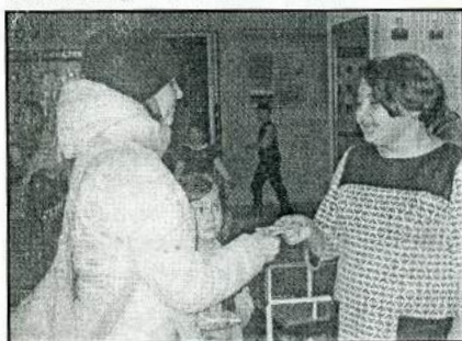
Волонтеры проводят акцию «Стоп, СПИД» - вручают памятные календары.

Принимают волонтеры и участие в социокультурной деятельности. Ко всем календарным праздникам волонтеры организуют поздравительные акции, изготавливают поздравительные буклеты, открытки и вручают их прохожим на улицах села.