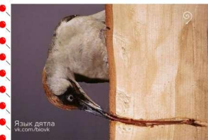
Язык дятла vk.com/lovk

находятся на коре сверху, но за вкусными личинками и жуками он ленится забираться вглубь дерева. А в зимнее время птица питается семенами еловых и сосновых шишек. Одним из самых удивительных органов дятла является язык. Он может вытянуться на две трети величины от его тела! Про дятлов есть много интересных фактов. Однажды дятлы приняли космический корабль за дерево. В 1995 году несколько дятлов дружно продолбили огромное количество дырок в изоляции стартовой ступени шатла «Дискавери», и из-за этого космический старт был отложен на два месяца! Вот такая замечательная птичка водится у нас в поселке. Проходя мимо дерева, на котором сидит дятел, ребята любуются его окраской и фотографируют.