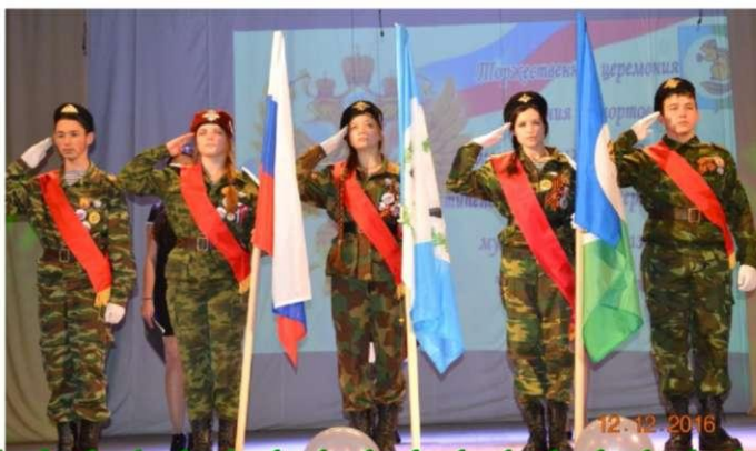
ПЕРЕПЕЧАТКА МАТЕРИАЛОВ ГАЗЕТЫ «ТРОПИЧКА» ЗАПРЕЩЕНА

Прекрасным украшением праздника стал наш известный и многим уже любившийся «зарничный» танец «Завет». Как всегда, путь назад был веселее, ведь мы поели и могли говорить, шуметь, делиться впечатлениями, несмотря на усталость. Однако через некоторое время мы