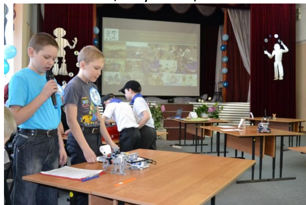
Моменты защиты проектов