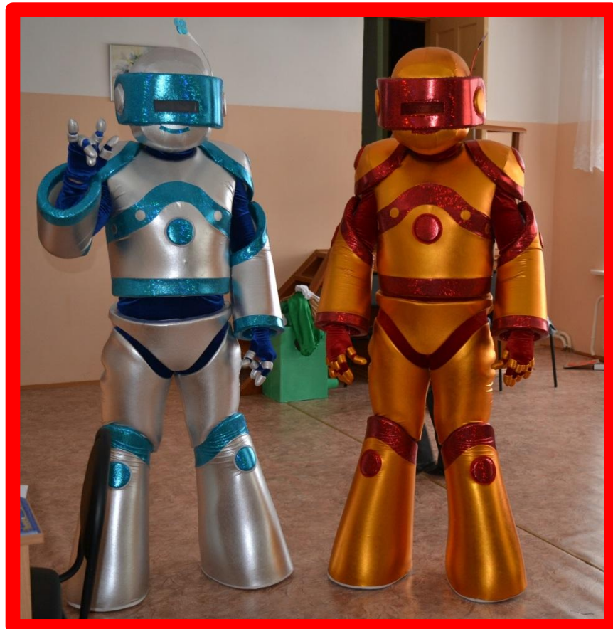
Главный сюрприз фестиваля!!!