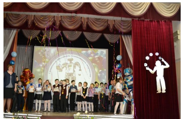
Моменты награждения и праздничный салют!!!