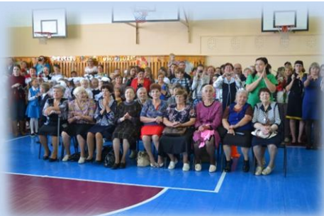
Почетные гости - Ветераны педагогического труда

Что ж, в добрый час и в добрый путь, Улыбку, школьник, не забудь! Нас школа в Страну знаний приглашает, А год учебный счет свой начинает! С новым учебным годом!