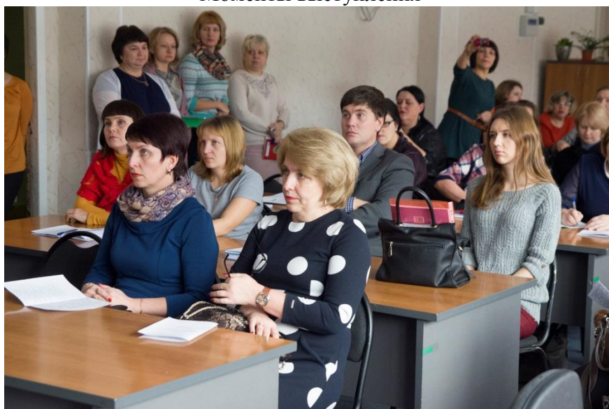
Участники Макариевских чтений г. Томск