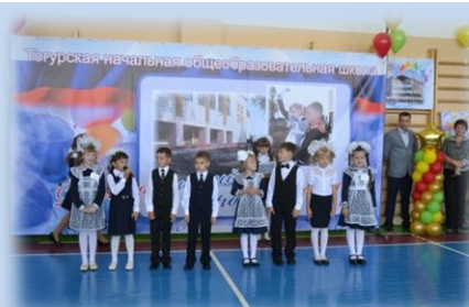
Первоклассники читают стихотворения