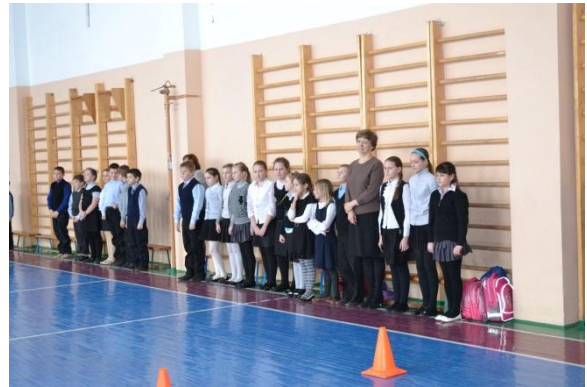
Команды и болельщики