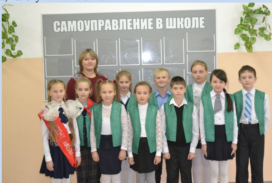
Школьный парламент 2016-2017 гг.

11 ноября состоялась торжественная церемония инаугурации Школьного Парламента. На ней присутствовали все жители республики «Тогурландия» - обучающиеся 2,3,4 классов. Школьному президенту, вице-президенту и министрам Парламента была вручена символика республики: лента президента, галстуки и жилеты.