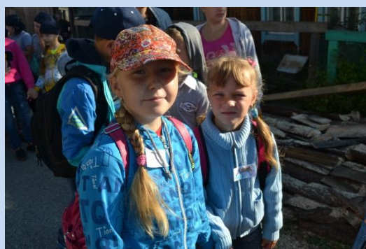
Фото с места событий

После того, как все участники расположились, «заморили червячка» (то есть перекусили) началось самое интересное: спортивные эстафеты, перетягивание каната и турниры по футболу. Задорный и залихватский смех проносился над полем. Болельщики активно поддерживали своих одноклассников задорными кричалками. На перетягивании каната царила жаркая, по-настоящему спортивная атмосфера. Выясняли, кто же самый сильный! На спортивных эстафетах ребята бегали в коробках, прыгали через скакалки и гимнастические палки, бежали с перемотанными скотчем ногами! Догадайтесь, кто же победил? Конечно же, дружба! После того, как окончились виды испытаний, все выстроились на общем итоговом построении. Всем участникам были вручены грамоты. А самое главное, хорошее настроение!!!