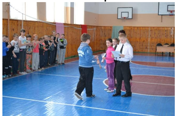
Моменты награждения победителей и участников