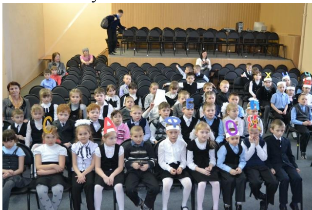
Ребята из 1а класса

В ходе мероприятия ребята отгадывали загадки, читали пословицы, составляли на магнитной доске слова, дописывали элементы букв.