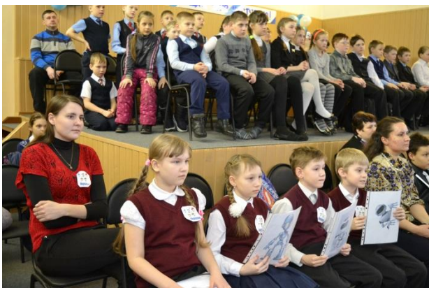
ФОТО С МЕСТА СОБЫТИЯ