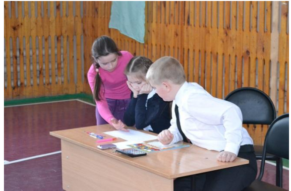
Строгое, но очень компетентное жюри