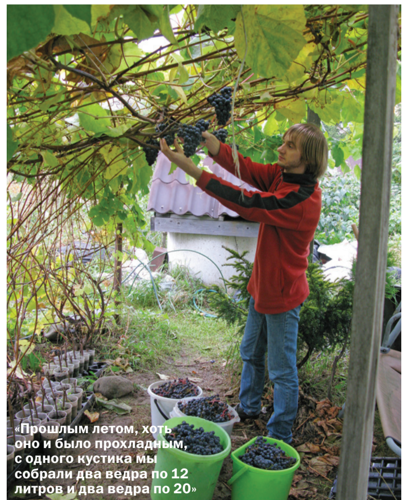
«Прошлым летом, хоть оно и было прохладным, с одного кустика мы собрали два ведра по 12 литров и два ведра по 20»