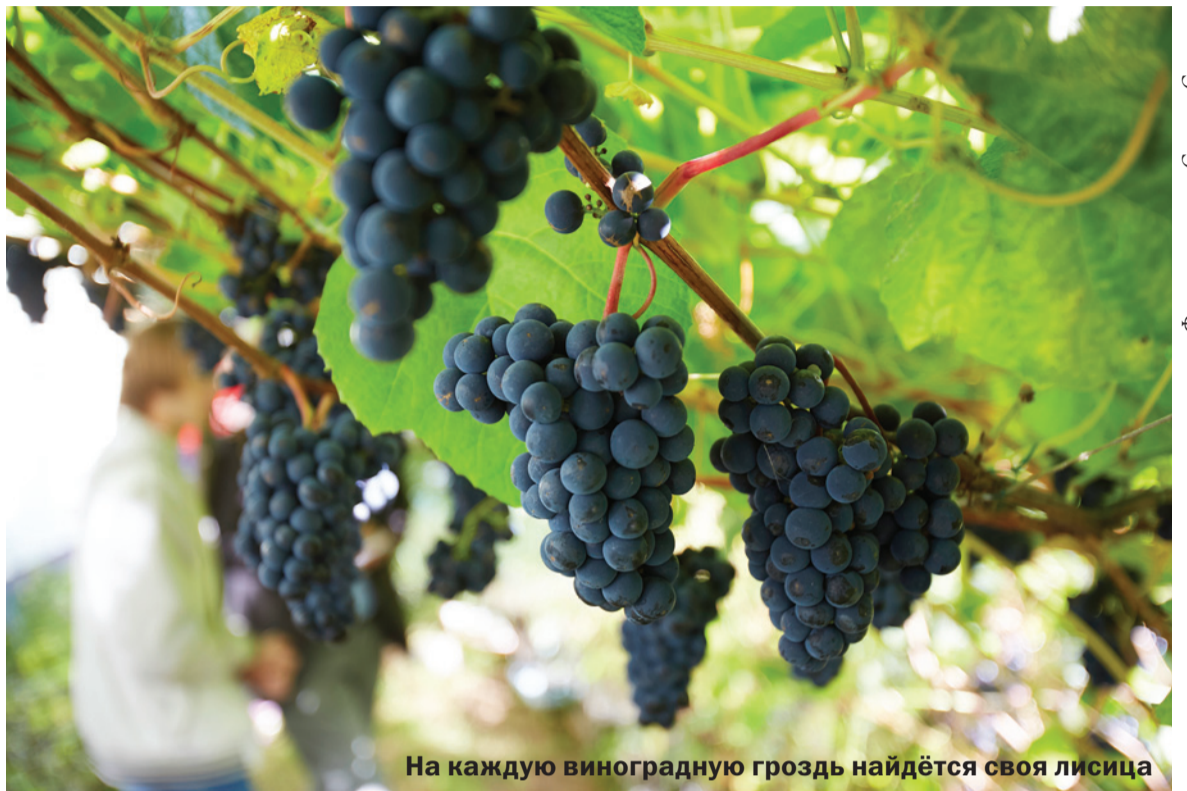
На каждую виноградную гроздь найдётся своя лисица