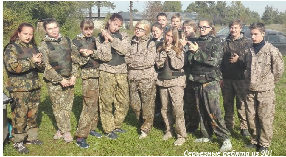
Серьезные ребята из 9В!

12 сентября в Гимназии прошел День здоровья. День выдался по-летнему теплым, и не было предела фантазии учеников! Где только мы ни побывали: в туристическом походе, школе верховой езды, посетили университет МЧС, пожарную часть, музей Астафьева в п.Овсянка и многое другое. Фоторепортаж с площадок Дня здоровья: