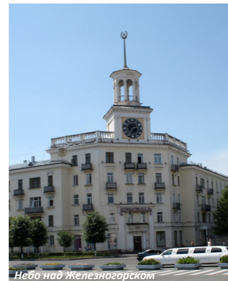
Небо над Железногорском

Хочу вам немного рассказать о своём городе. Но сначала обсудим не похожие на него, города - миллионники, например. Куча ежедневных идей, многочасовые пробки, неожиданные встречи. Такие города наполнены деньгами, высотными домами,