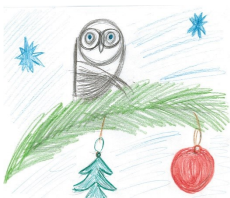
Гончаров Никита, 6 «Б» класс