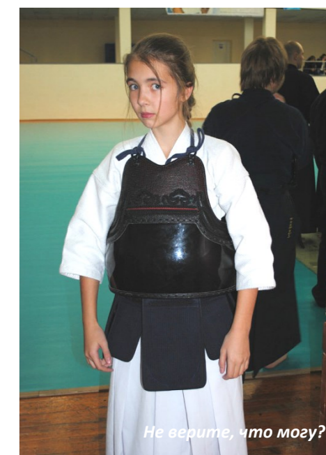
Не верите, что могу?