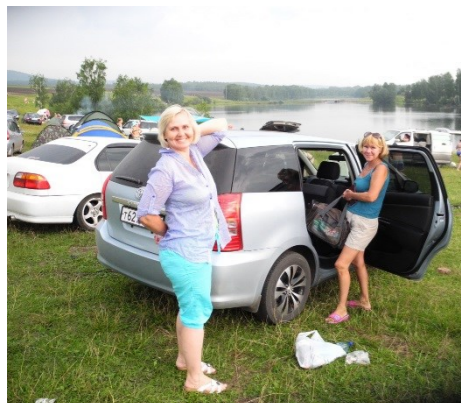
У нас с подругой и машина напополам!