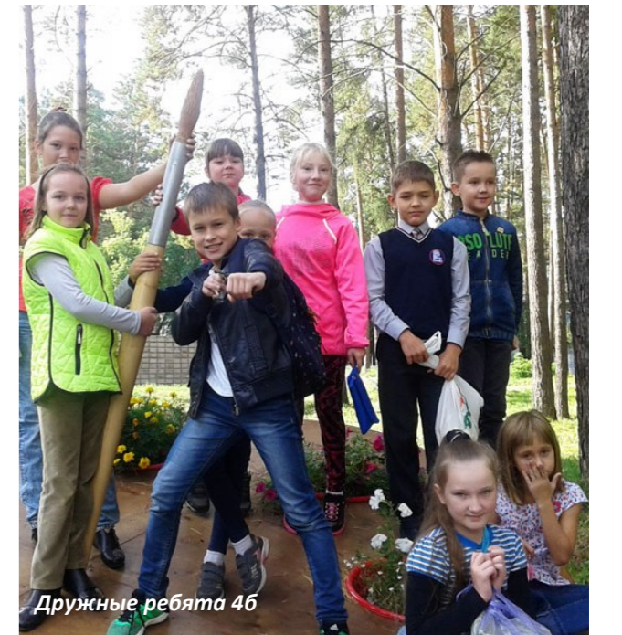
Дружные ребята 4б