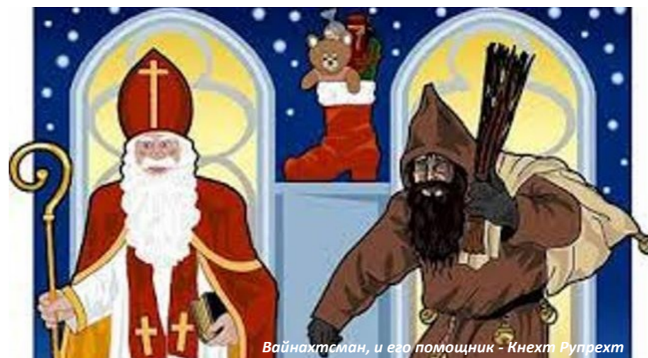
Вайнахтсман, и его помощник - Кнехт Рупрехт