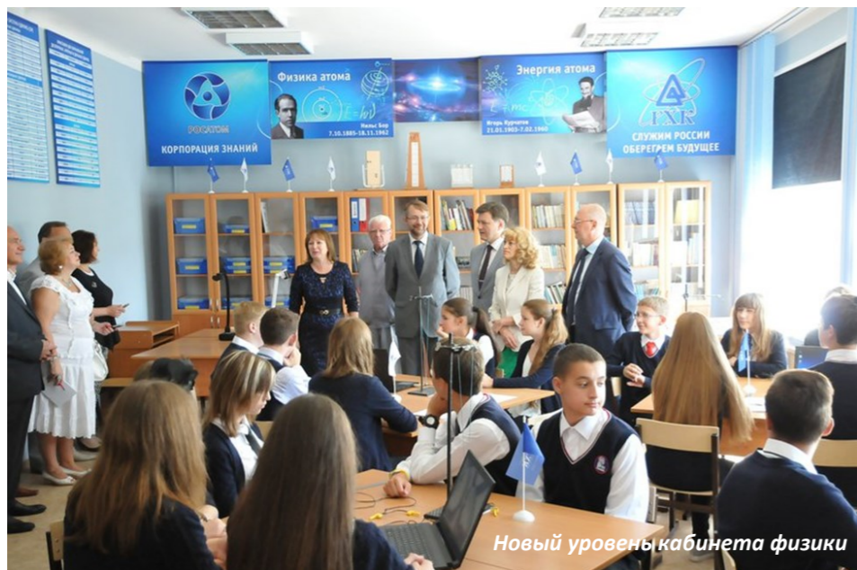
Новый уровень кабинета физики

Также в нашей школе происходит разделение на профильные классы. В этом году 10а стал «атомным классом», потому что он является физико-математическим. Это 27 человек с хорошими знаниями по физике, математике и информатике. Ребята прошли специальный отбор.