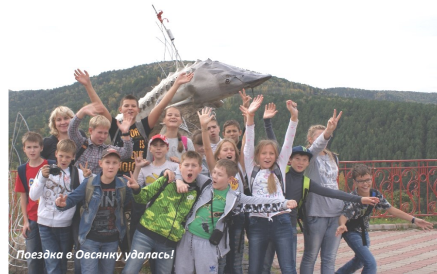
Поездка в Овсянку удалась!