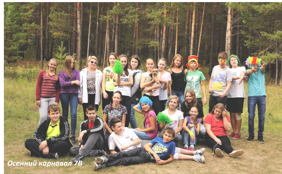
Осенний карнавал 7В