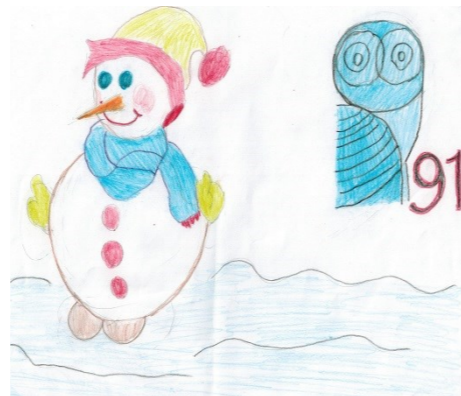
Баранов Никита, 6 «Б» класс