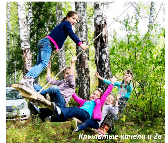
Крылатые качели и 2в