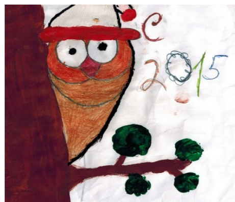
Томилов Максим, 6 «Б» класс