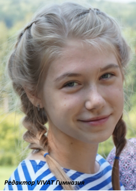
Редактор VIVAT Гимназия