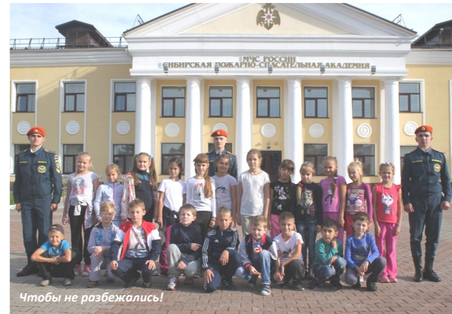
Чтобы не разбежались!