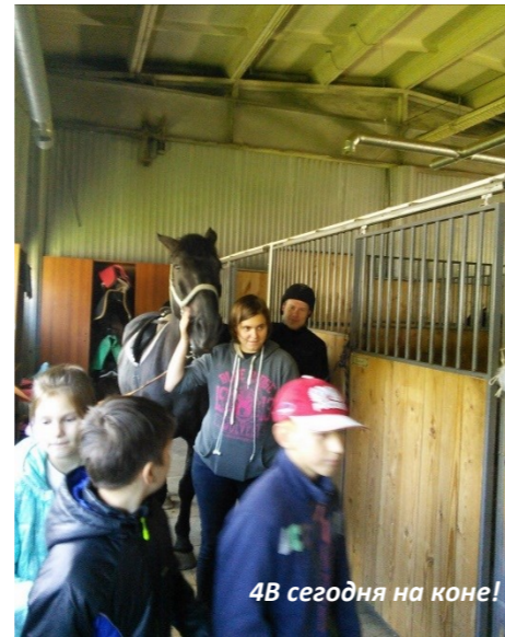
4В сегодня на коне!