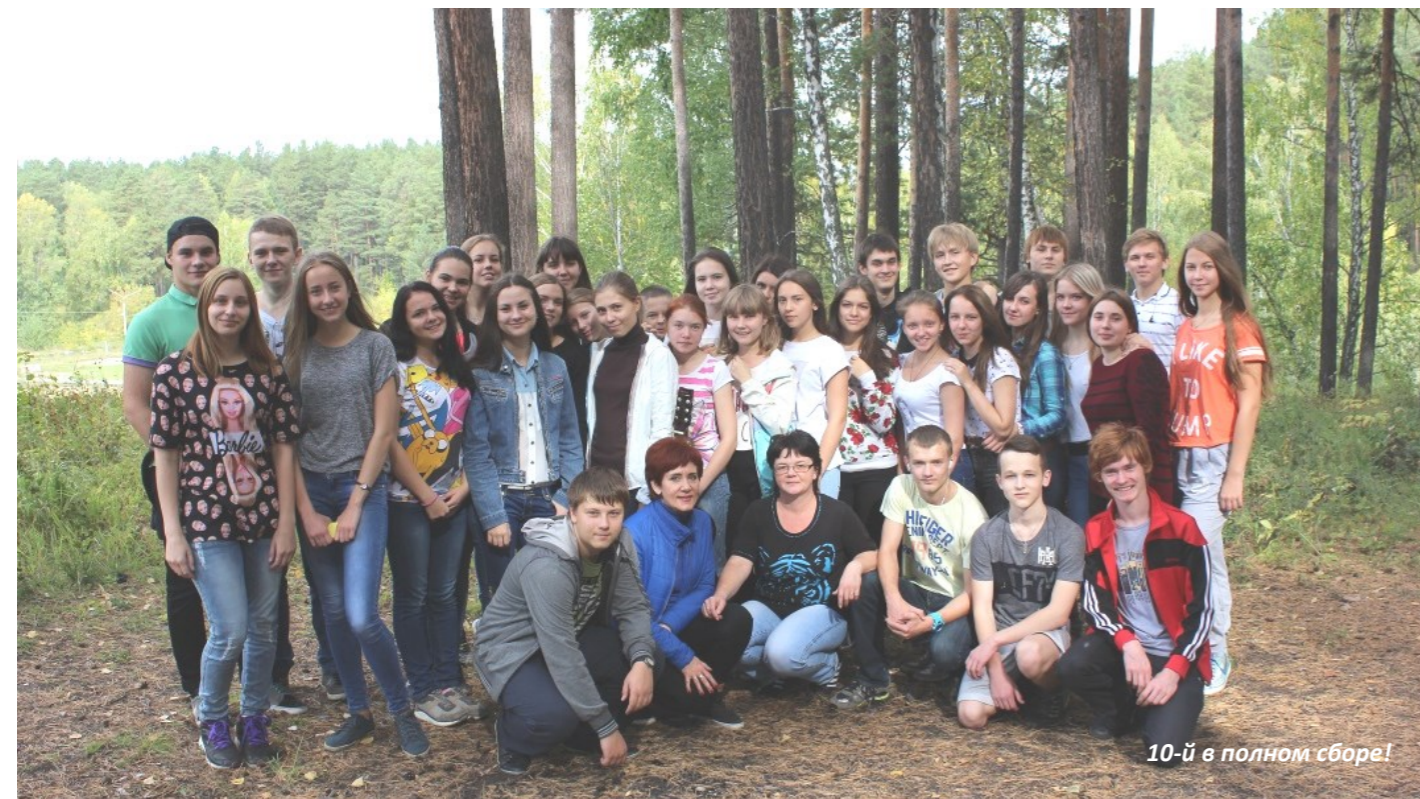
10-й в полном сборе!