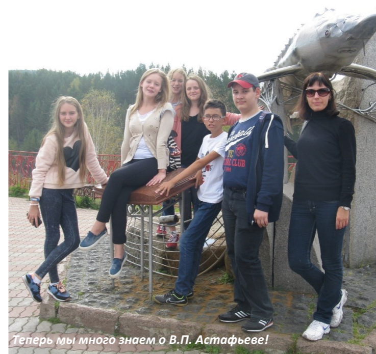
Теперь мы много знаем о В.П. Астафьеве!