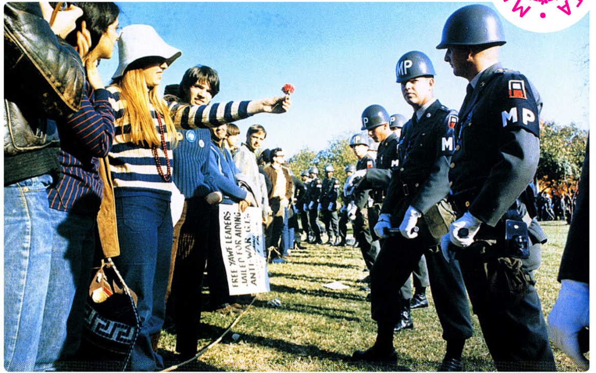
Участница демонстрации против Вьетнамской войны протягивает цветок офицеру военной полиции. Пентагон, Арлингтон, штат Виргиния, 21 октября 1967 г.

Среди субкультур побеждают те, что оказываются наиболее коммерчески успешными. Как сказал Пелевин в «Generation П»: «В области радикальной молодёжной культуры ничто не продаётся так хорошо, как грамотно расфасованный и политически корректный бунт против мира, где царит политкорректность и всё расфасовано для продажи». Рейв, хипхоп и даже радикальный рок дали начало тысячам успешных музыкальных бизнес-проектов. Культура потребления всех их поглотила, переварила и поставила себе в услужение.