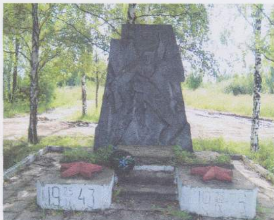
Единственный в Вязме памятник, установленный в честь освобождения Смоленской области от немецко-фашистских захватчиков, находится на территории поселка Кирпичного завода.