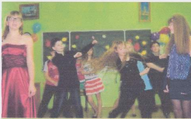
Выступает танцевальная группа «Ириски»

Но ближе к теме, друзья! А тема наша - «Осенний блюз»! В нашем классе сложилась традиция: осенью проводить мероприятия для родителей. Такие события вносят колорит в нашу школьно-семейную жизнь. Итак, праздник состоялся! Наш семейный классный час мы провели в конкурсном-игровой форме. Участие в программе приняли команда учащихся 6Б класса «Высокая энергия» и команда родителей «Мамочки». Для родителей было неожиданностью соревноваться с нами. Сначала наши мамочки вели себя несколько растерянно, но спустя пару конкурсов наши соперники собрались и включили свой творческий потенциал. Обе команды активно проявляли себя в следующих конкурсах: «Приветствие команд», «Восстанови пословицу», «Путаница», «Самый ловкий!» и др.