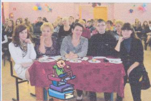
Самое честное и справедливое жюри