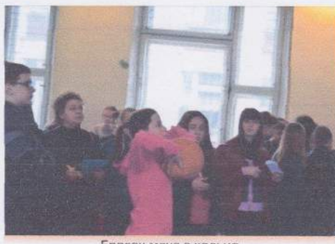
Бросок мяча в кольцо.