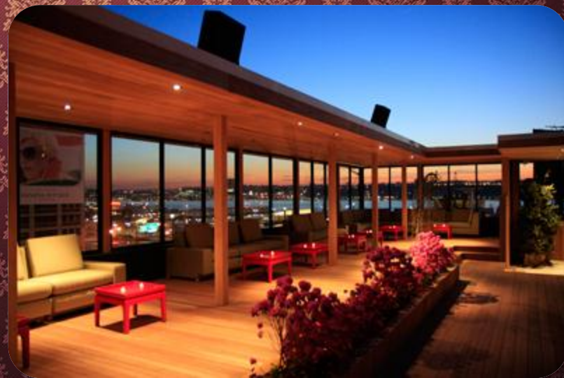
Клуб Hudson Terrace в Нью-Йорке