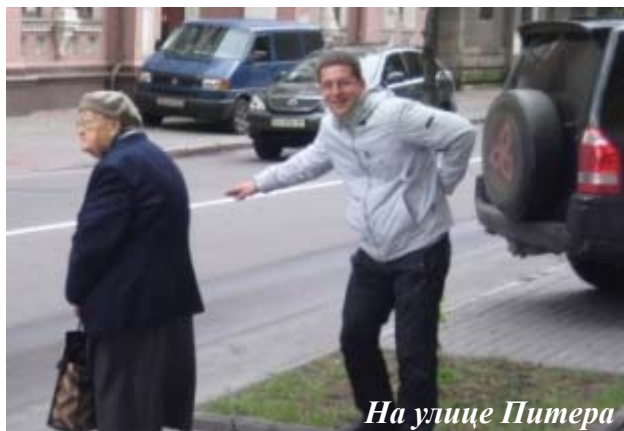
На улице Питера