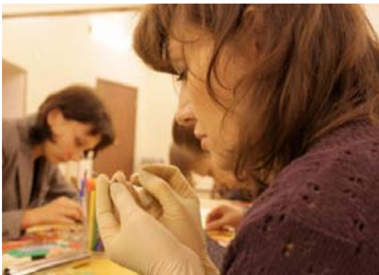
Мечта любого - найти себя в любимом деле

Танцы. В Петербурге очень много танцевальных студий, где можно освоить базовый уровень того или иного танца. А вот развить умения и выйти на профессиональный уровень можно будет летом в Чехии, в крупнейшем танцевальном лагере Европы Street Dance Kemp. Поездка обойдется в 1 – 1,5 тысячи