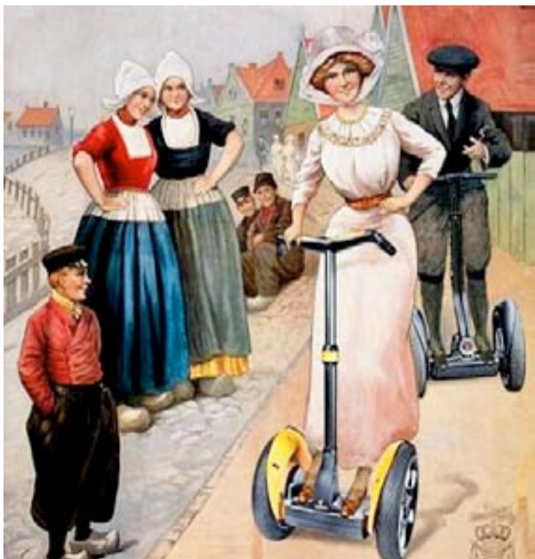
Сегвей превратит вас из обычного пешехода в равноправного участника дорожного движения