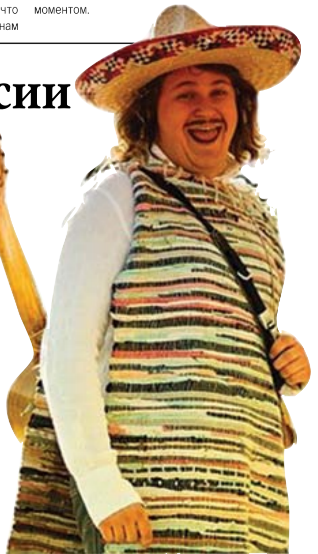
Спасибо России, ведь именно здесь я научился находить выход из любой ситуации! Записала Олеся ВОСКРЕСЕНСКАЯ

12 лет, мы с нетерпением ждем своего 18-летия, желая поскорее стать взрослыми. Когда нам 20 лет и мы начинаем сталкиваться со взрослыми проблемами, то хотим вернуться в детство. Каждый из нас хочет, чтобы жизнь замедлилась. Но парадокс: мы отказываемся жить в медленном темпе. Мы всегда хотим действовать, бежать все быстрее и быстрее. Раньше ритм жизни был медленнее? Мне не кажется, что сейчас время течет быстрее, чем раньше. Мы просто привыкли делать всё быстро, сосредоточившись на самых важных вещах. А мне приятно иногда «терять» своё время гуляя по улицам. Во время этих «бесполезных» прогулок я не чувствую убегающего времени и наслаждаюсь моментом.