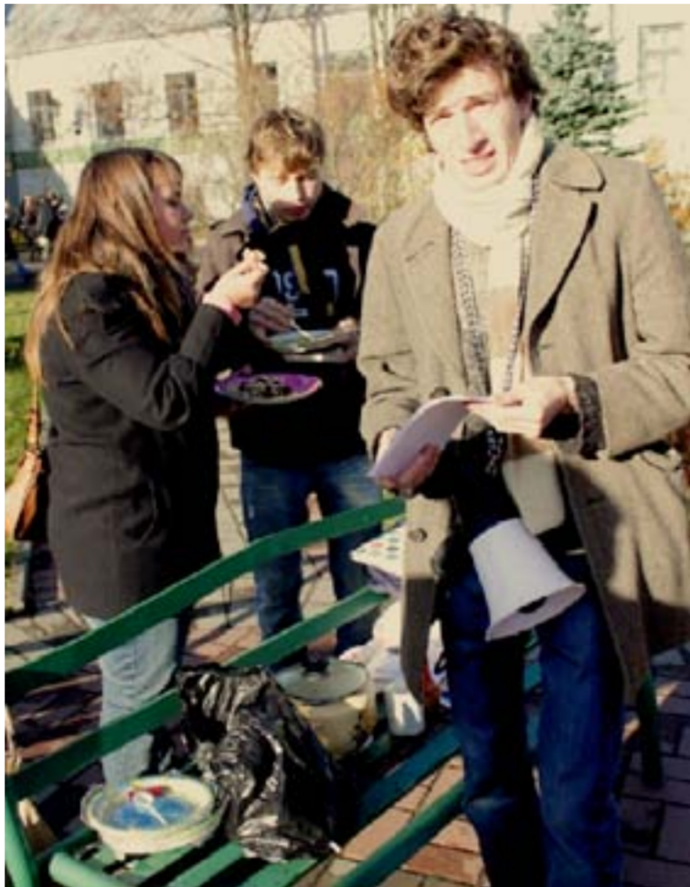
Рупор, листовки, кастрюли - борьба против высоких цен шла полным ходом

Сколько рублей Вы ежедневно тратите в столовой?