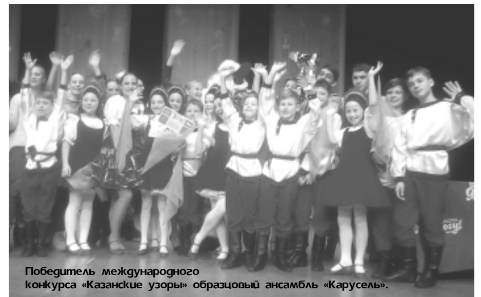
Победитель международного конкурса «Казанские узоры» образцовый ансамбль «Карусель».