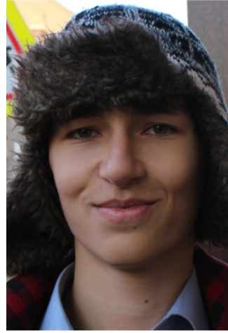
Шейх (ученик, 11 класс)

Да, я считаю себя современным. Современный человек должен много знать о цивилизации, о науках, о том, что сейчас происходит в мире. Что касается меня, то я в свободное время читаю научные книжки и играю в хоккей. А современные гаджеты у меня есть, «Айфон», например.