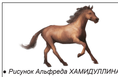
• Рисунок Альфреда ХАМИДУЛЛИНА