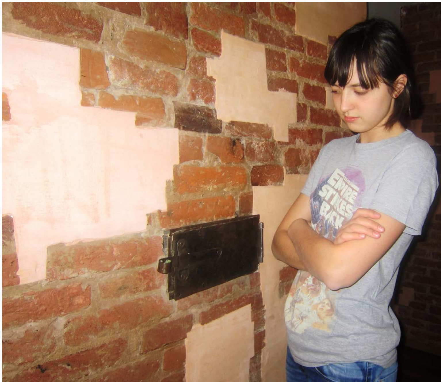
Кто тебя выдумал, чудо-зверь?

А вы? Насколько глубоки ваши знания об этой профессии? Если затрудняетесь ответить, не расстраивайтесь, а просто читайте газету «Печник».