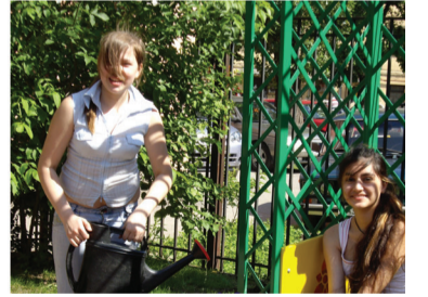
Комаж Ирины Горской