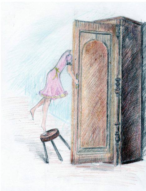
Рисунок Елены Балашовой